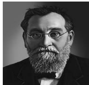
Илья Ильич Мечников